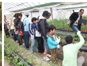
トマトの定植体験